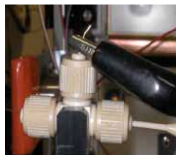
キャピラリーカラム電圧印加部