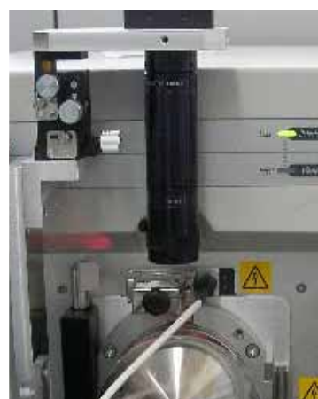
カメラ搭載(オプション)